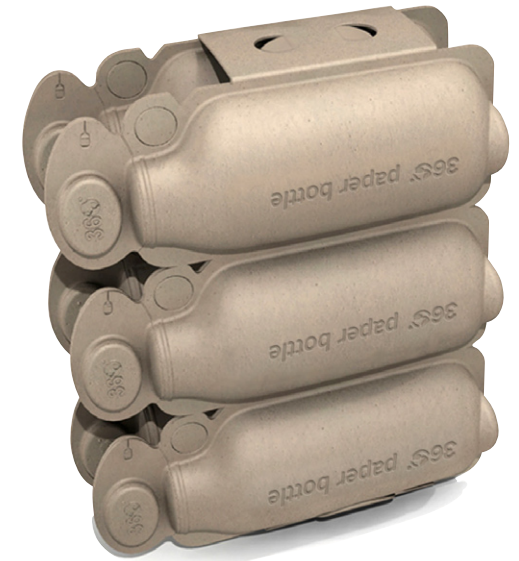
Le pack de 6 sans plastique.

La bouteille en papier 360 propose une vision durable du futur. C'est le premier conteneur en papier totalement recyclable et 100% à base de ressources renouvelables. Versatile par sa variété d'applications en grande consommation, ce conteneur est composé de matériaux aptes au contact alimentaire et totalement recyclables. Il permet de diminuer considérablement l'énergie consommée pendant tout le cycle de vie du produit sans sacrifier en fonctionnalité.